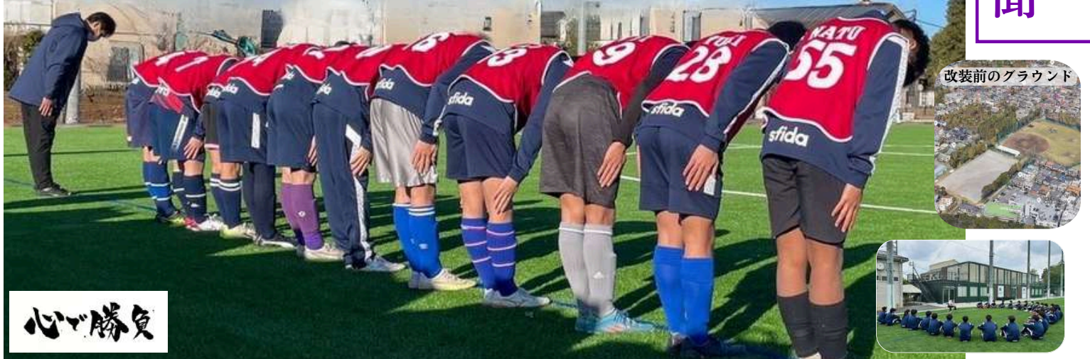
改装前のグラウンド